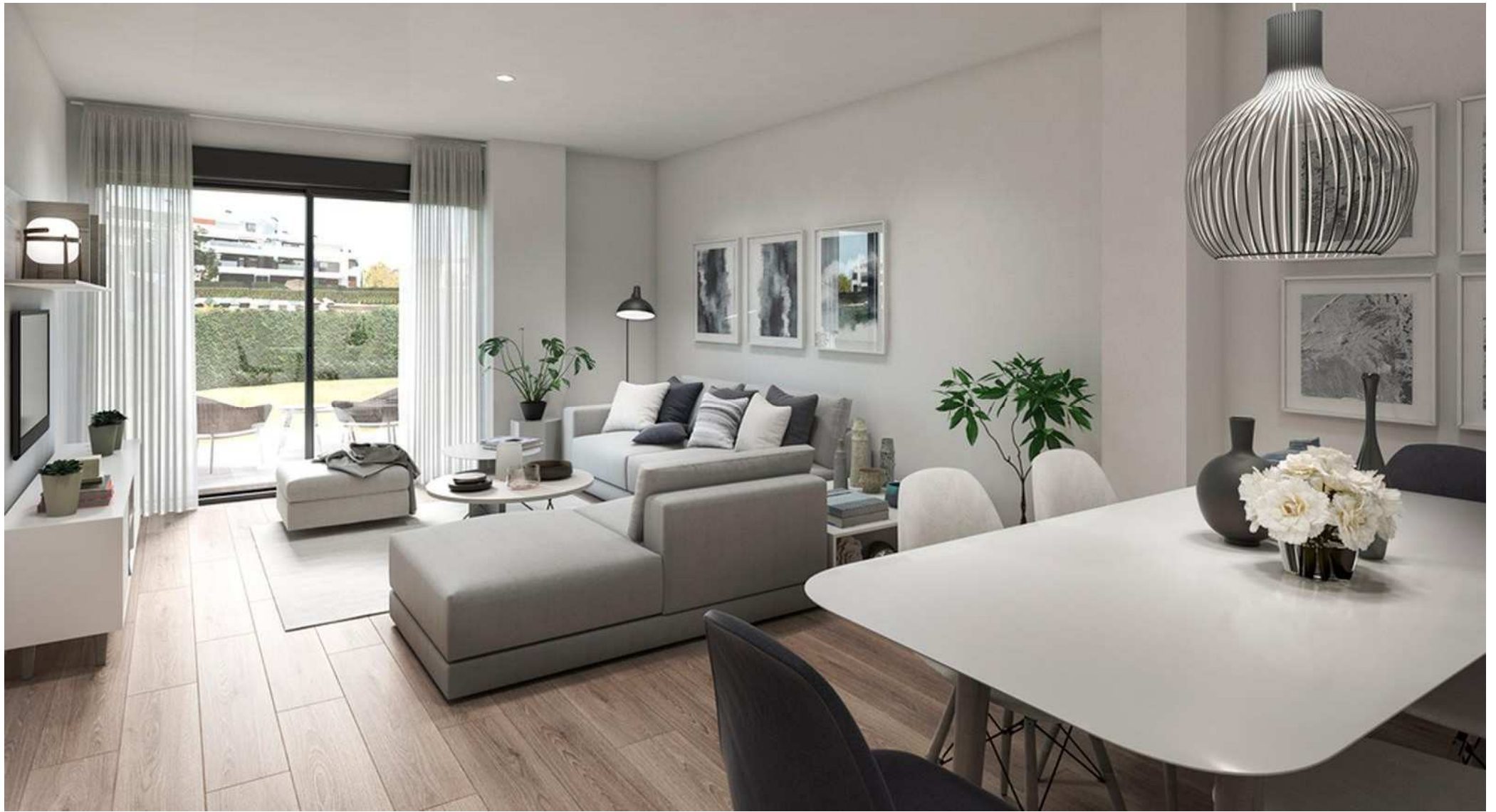
Interior de la vivienda. Acabados